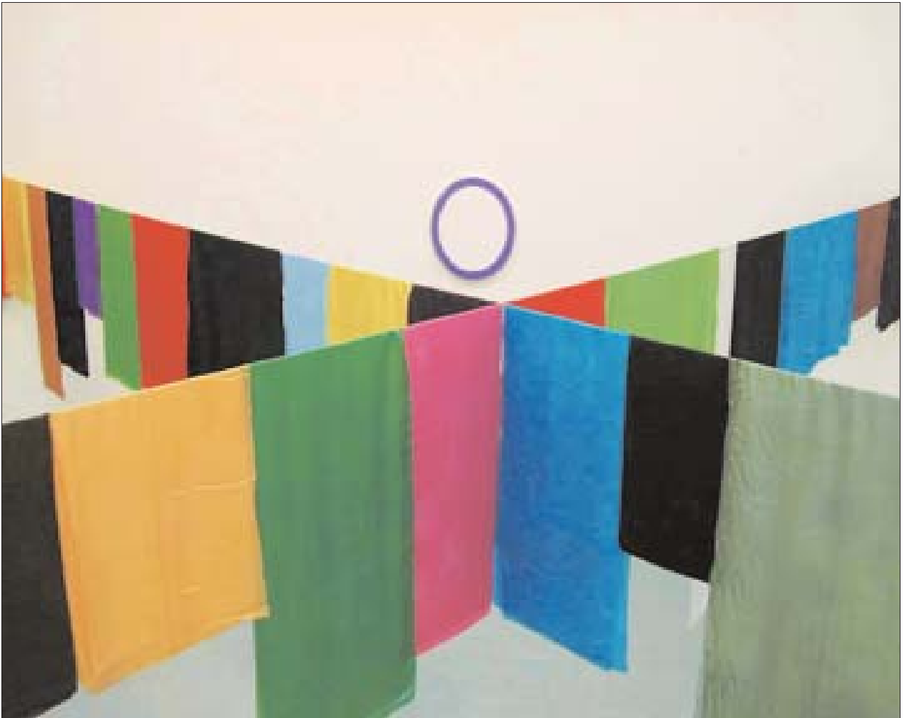
Installation soie colorée (détail). 2003, soies teintées, galerie Eric Dupont.