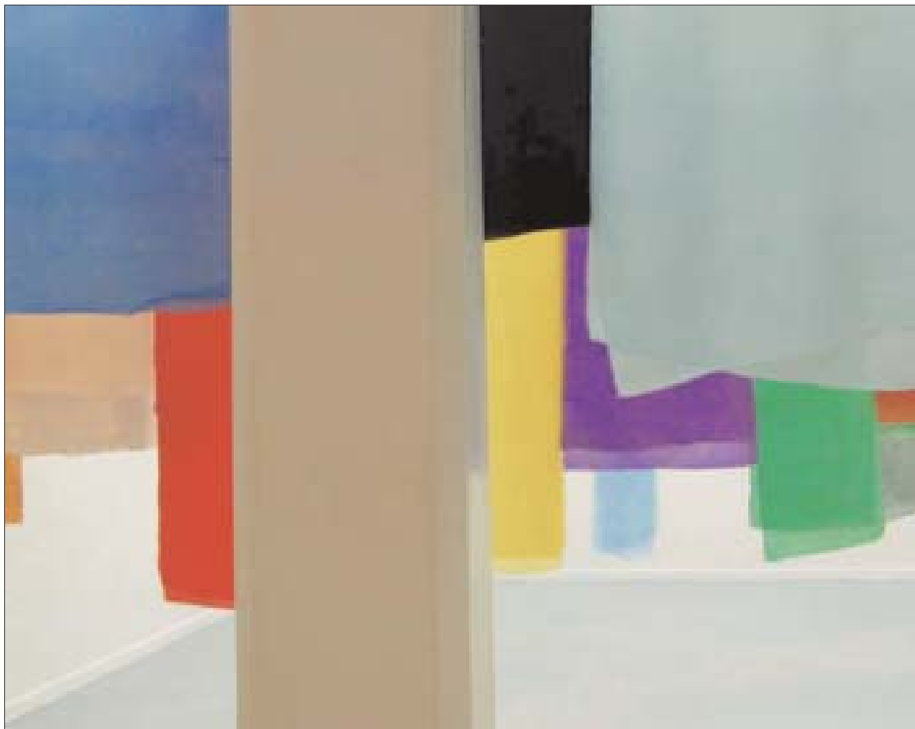
Installation soie colorée (détail).

2003, soies teintées, galerie Éric Dupont.