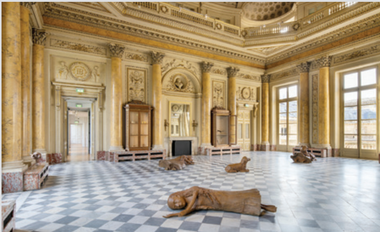
Vue de l'exposition Kiki Smith, Monnaie de Paris, 2019. Au sol : Sleeping, Wandering, Slumber, Looking About, Rest Upon. 2009-2019, bronze, dimensions variables.