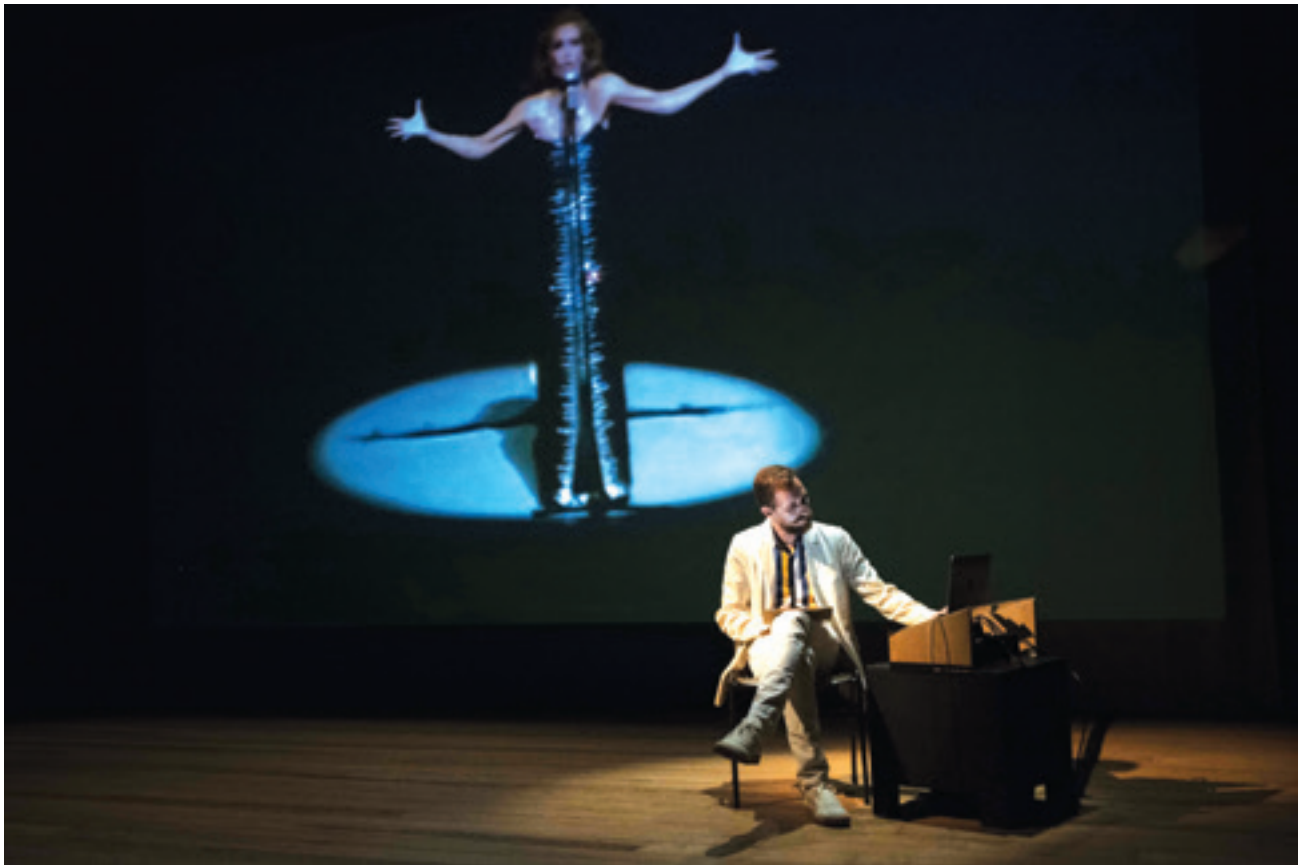
En haut : Sergueï Eisenstein. Ivan le Terrible . 1945, film noir et blanc, 103 min.