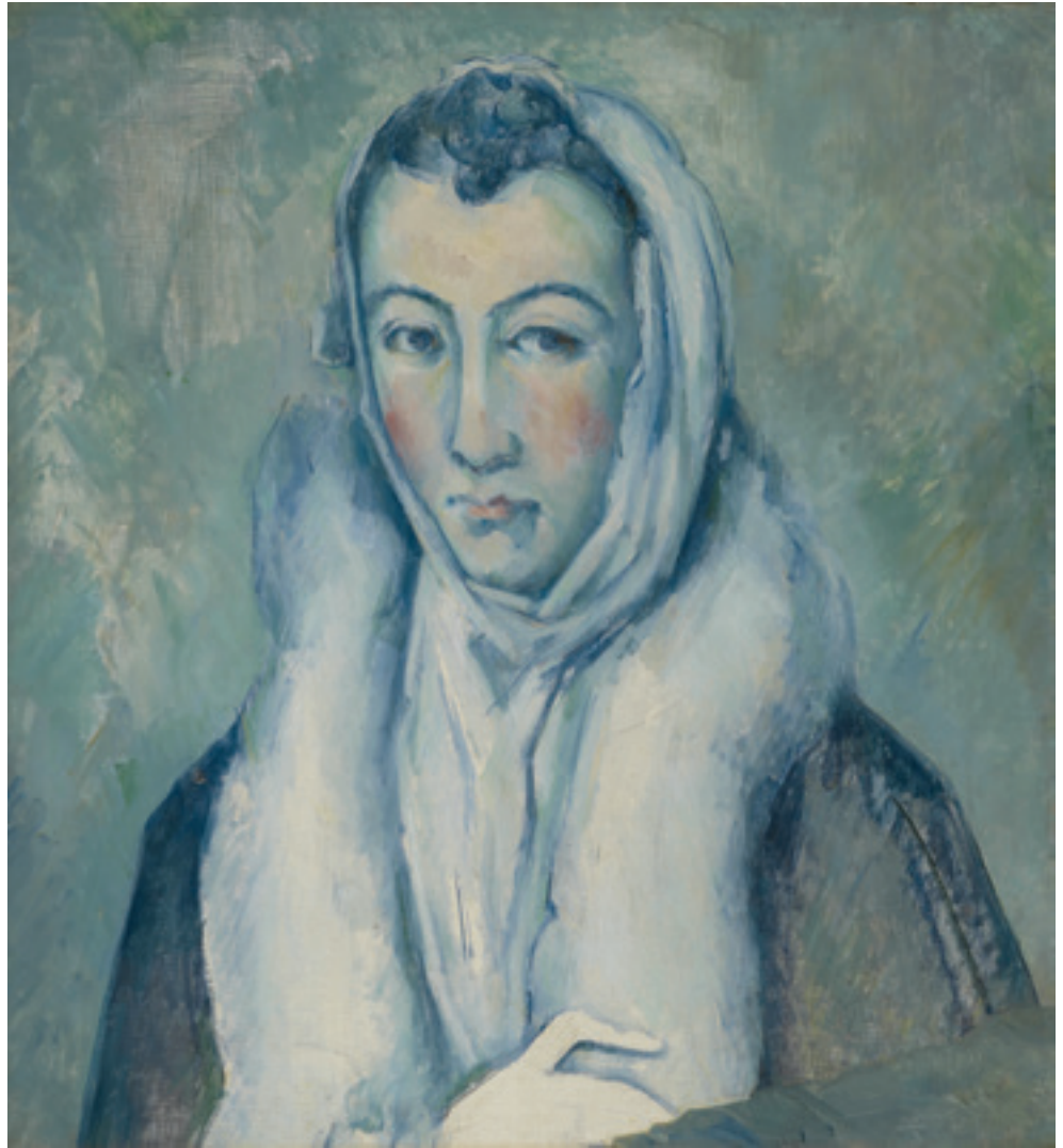
Paul Cézanne. Dame à la fourrure, d'après El Greco. 1885-86, huile sur toile, 53 x 49 cm. Collection privée, Londres.

trop extravagant : « Qui pourrait croire que le Greco retouchait maintes et maintes fois ses peintures, écrit-il, et qu'il en faisait d'horribles ébauches pour affecter la vigueur et la sûreté de sa main ? » Redécouvert à la toute fin du XIX e siècle, après s'être tenu coi, dans l'oubli, Greco effectue un retour en force dans la peinture espagnole. Tandis que les impressionnistes Rusiñol et Sorolla transcrivent les violents contrastes de l'ombre et de la lumière en repartant de la leçon du maître de Tolède, Picasso fait s'étirer ses personnages de l'époque bleue à l'exemple de Cézanne qui, lui aussi, copie avec passion ses portraits élongués.