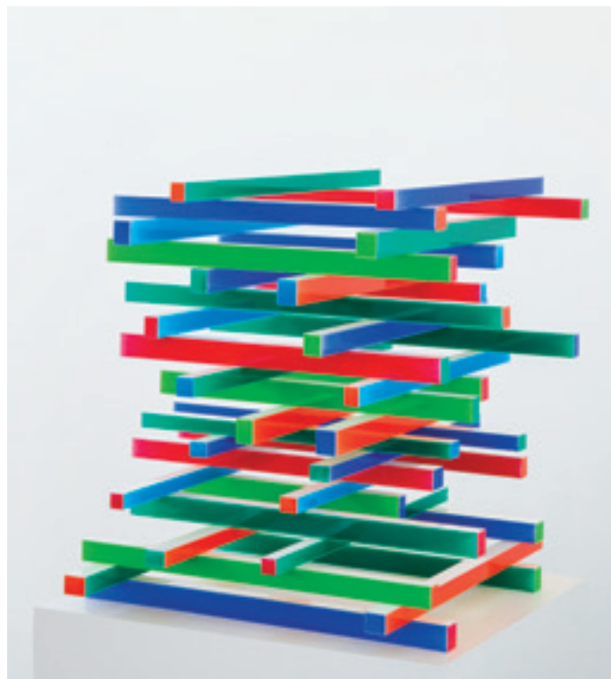
Construction 1. 2014, acrylique et vernis sur bois, 57 x 57 x 54,5 cm.

« Le simple fait », écrit Guillaume Cassegrain dans son livre La Couleur, histoires de la peinture en mouvement , « de "laisser tomber" une matière fluide pourrait incarner le geste primordial d'où naît l'art. » Chez Elissa Marchal, il ne s'agit pas de représentations de coulures mais de sa présentation même en aplats tendus et compacts. Les peintres qui posent la couleur en couches multiples et la poncent tels Al Martin, Kwang Bum Jang ou Christophe Verfaille retrouvent les couches colorées enfouies et représentent le travail du tableau ou du temps par une archéologie colorée. Au contraire, dans la picturalité d'Elissa