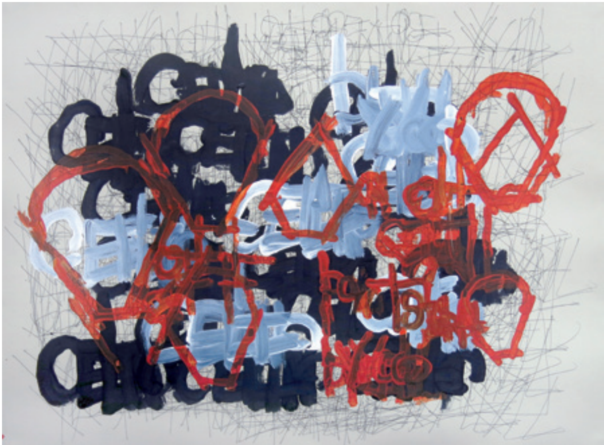
Sans titre (red light bulbs with black and white). 2013, acrylique et encre sur papier, 56 x 76 cm. Courtesy Creative Growth Art Center, Oakland et Christian Berst art brut, Paris.