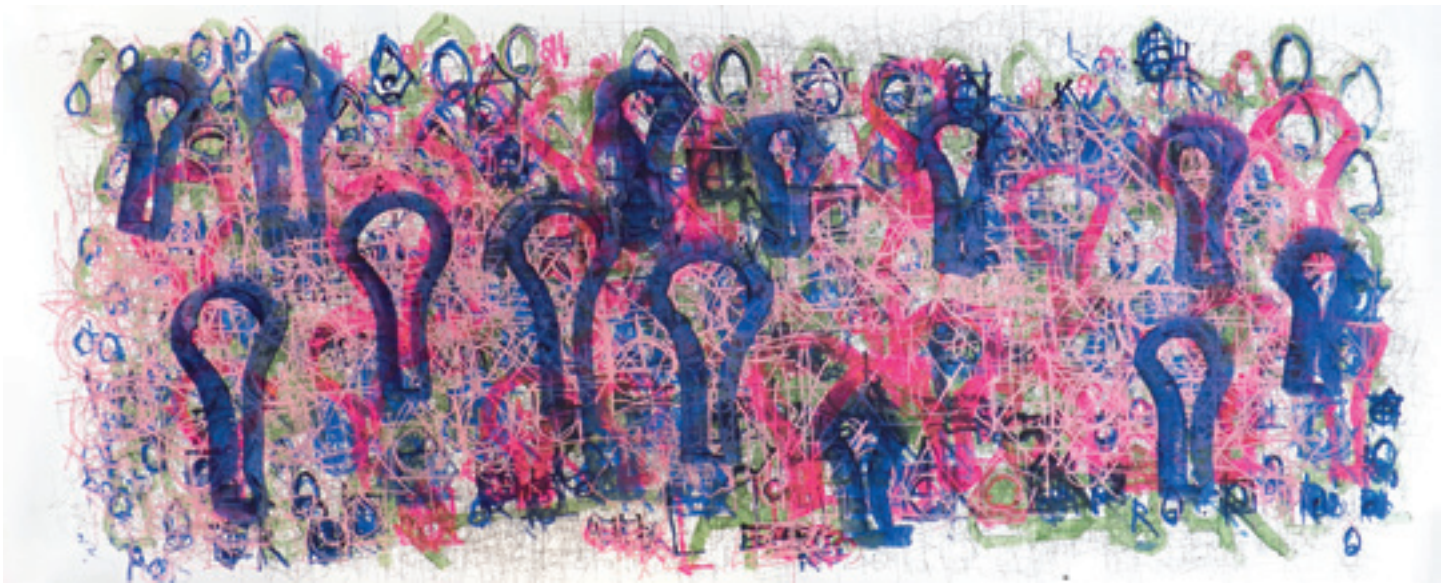
Sans titre (pink with purple light bulbs), 2013, acrylique et encre sur papier, 106,7 x 249 cm.

pour y élaborer un langage propre grâce à ses compositions instinctives. En périphérie, on trouve des mots en lettres capitales, des lettres qui se chevauchent légèrement, des mots qui se répètent et des lignes nettes qui croisent des courbes franches. Sans maniérisme, le texte s'intensifie progressivement au point de devenir magmatique lorsque l'on atteint le centre de la création. Loin des petites écritures cursives de Dwight Mackintosh qui s'allongent sur la feuille, Miller progresse rapidement sur la surface et déploie son lexique avec assurance. Lorsqu'il quitte l'atelier, il s'approprie le moindre morceau de papier pour continuer à y griffonner. Bien que le langage qu'il développe ait rapidement perdu sa fonction initiale, son entreprise apparaît donc comme lui étant profondément nécessaire.