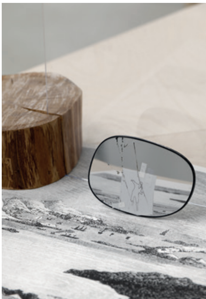
Dans quel sens traverser les antipodes (détail). 2018, installation, technique mixte, dimensions variables.

Cela est lié au fait que j'occulte volontairement le contexte. On ne sait ni où, ni quand les scènes que j'imagine se passent, ni qui en sont les personnages. Je fais en sorte qu'il y ait comme une perte de repères pour que chacun invente sa propre histoire. Moi-même, je suis le plus souvent incapable de me rappeler ce qui m'est passé par la tête au moment où j'ai créé telle ou telle situation. Si j'ai une trame au début, je la perds très vite parce que, quand je commence un travail, je n'aime pas trop savoir à quoi il va ressembler à la fin. Ça me gâche le plaisir de la recherche, la surprise de l'accident. Tout mon travail est basé là-dessus.