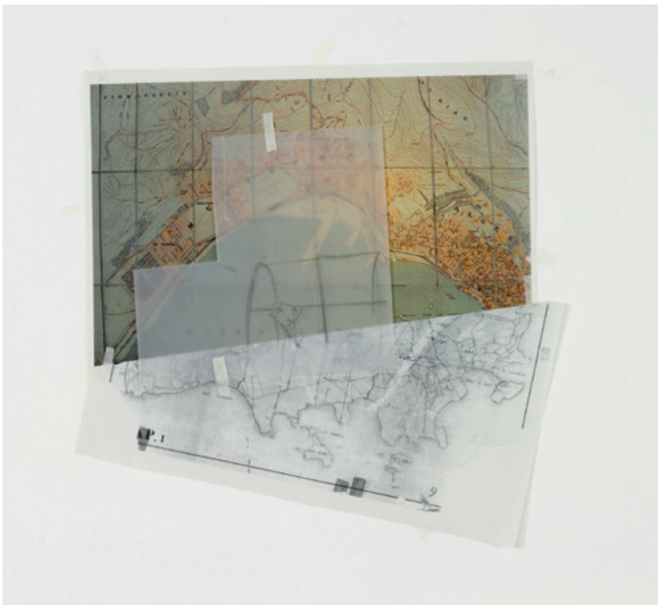
Dans quel sens traverser les antipodes (détail). 2018, installation, technique mixte, dimensions variables.