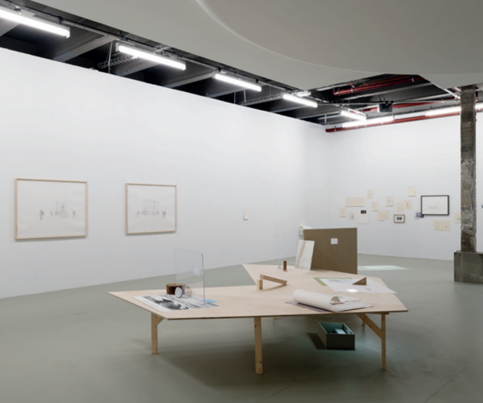
Vue de l'exposition de Massinissa Selmani, Ce qui coule n'a pas de fin - Prix SAM 2016, Palais de Tokyo, Paris, 2018.

Vos dessins en appellent à une véritable « cuisine » graphique qui joue d'images sans rapport, de supports de toutes natures, d'outils très divers, de potentielles projections, de dispositifs plus ou moins complexes, etc., comme si vous vouliez avec force vous départir d'une appréhension convenue du dessin, voire vous en méfier. Qu'est-ce donc qui gouverne une telle posture ?