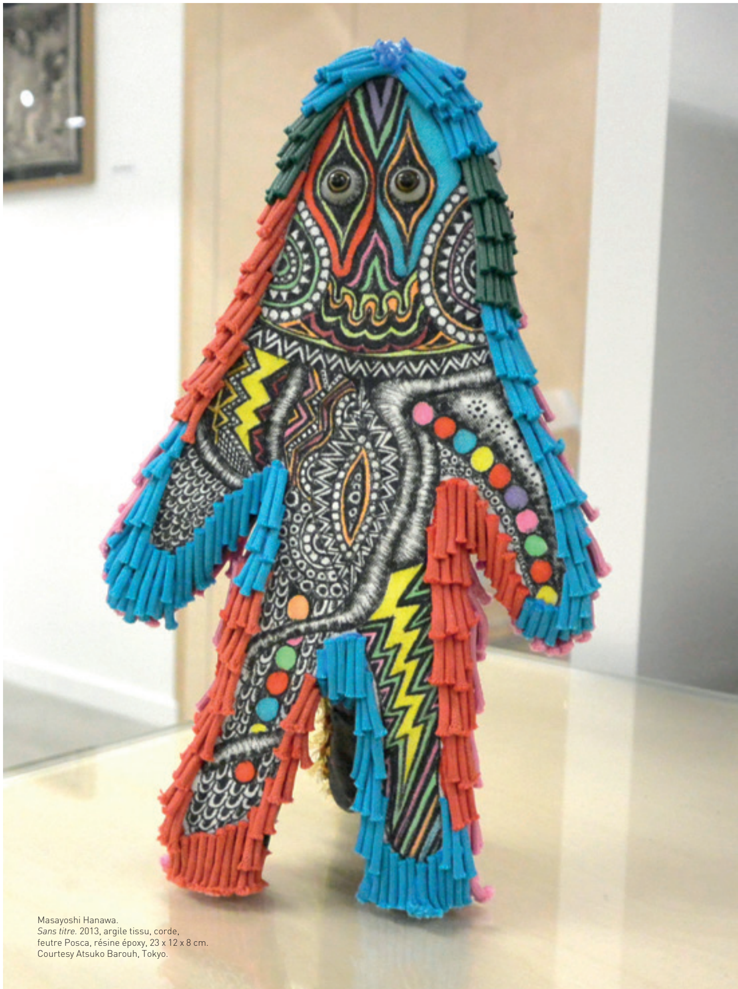
Masayoshi Hanawa. Sans titre . 2013, argile tissu, corde, feutre Posca, résine époxy, 23 x 12 x 8 cm.