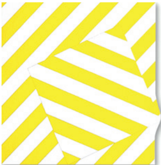
André Stempfél. Band's . 2008, encre vinylique sur toile, 100 x 100 cm.

«géométriques» et des «concrets», avec leurs œuvres construites selon des règles mathématiques, telles celles de Ellsworth Kelly (1953-54), Seuphor (1957 à 65) et Honegger (1965 à 68), soutenus par un puissant réseau de galeries en Europe du Nord, aux États-Unis et en Australie.