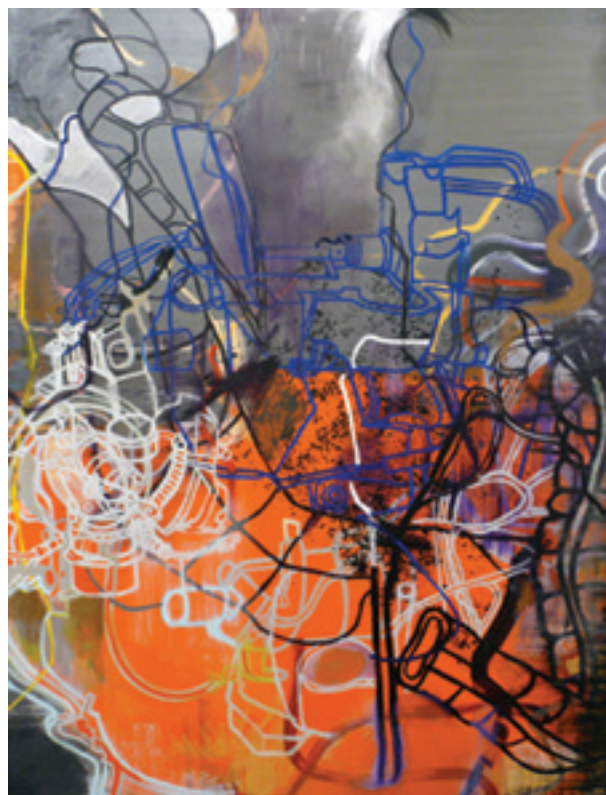
Lydia Dona. Reflections into Orange Alert . 2012, huile, acrylique sur toile, 213 x 162 cm.

À travers ces œuvres d'une abstraction toute conceptuelle, on comprend que la fin du modernisme ne fut en rien celle de l'abstraction. Mais bien sa mutation dans un temps éphémère de plus en plus incertain. Reste alors à penser le monde en peinture, entre catastrophe et beauté, dans une éthique de la matière qui est aussi une esthétique. ■