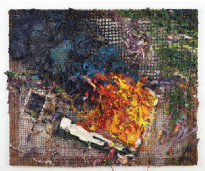
Fabian Marcaccio. Waco . 2012, chanvre de Manille et corde d'escalade tissés à la main, peinture alkyde, silicone et bois, 221 x 257 x 15 cm.

Ce plan de composition contre « les chaoïdes », ce saut en dehors de la catastrophe, c'est précisément ces plans-couleurs, toujours en surface, mais pris dans de nouvelles turbulences. Car tout diagramme est par nature ambigu, force de construction et de destruction. De même les plans colorés qui se détachent et s'évanouissent en nuages de cendre,