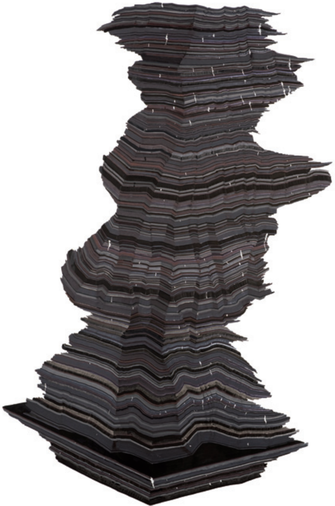
Sculpture # 9. | 2011, feutres noirs sur papier, 180 x 130 cm.