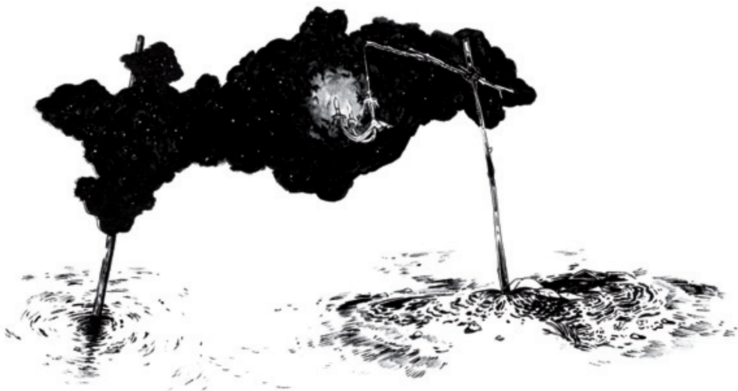
Représentation de matière sombre autour d'un point lumineux. 2011, encre sur papier, 65 x 50 cm.