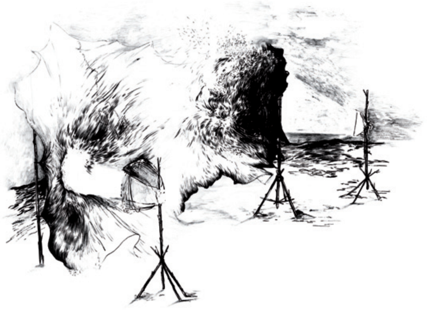
Sans titre. | 2011, encre sur papier, 65 x 50 cm.

centre d'art de Colomiers, à l'occasion du Printemps de Septembre 2009 –, Benchamma s'abandonne alors aux délices implisives de la forme. Il met au monde une image abstraite qui s'apparente à celle du big bang, en lien par ailleurs avec l'iconographie des peintures de la Renaissance figurant l'apparition divine par la lumière, c'est-à-dire deux représentations totalement opposées, l'une religieuse et l'autre scientifique, mais qui se rejoignent. S'agit-il de jouer du contrepoint d'une chute et d'une ascension, il trace au trait un implacable dessin – The Apparent Stability of Things (2010) – qui organise la suggestive attraction de deux masses aux allures de stalactites et de stalagmites que gouvernerait on ne sait quel subtil magnétisme. S'agit-il d'une série comme Sculpture (2009-2010) et l'artiste se laisse simplement guider par cette idée de vouloir faire advenir la forme comme s'il lui fallait sculpter un dessin. Usant de tous les protocoles plastiques, il cherche à densifier la surface à grands renforts de stries, de percées, de masses boursouflées et de formes chues qui participent à la création d'un effet de masse appelant in fine la nécessité d'un socle et s'exposant dans une altérité brute