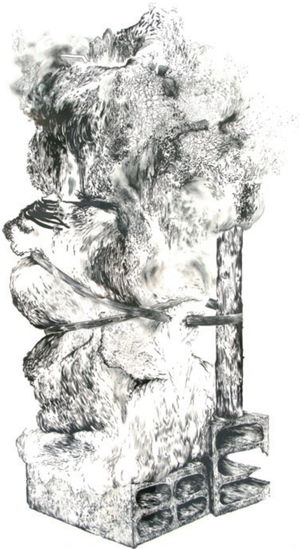
Sculpture #12. 2011, encre sur papier, 180 x 125 cm.