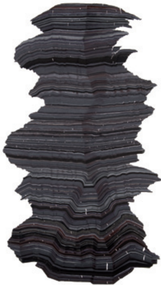
| Sculpture #7. | 2010, feutres noirs sur papier, 180 x 130 cm.

lacs d'une réflexion sur le dessin, toutes considérations plastiques confondues. Non qu'il cherche à brouiller les pistes, ni à perdre le regard, mais il aspire à instruire une esthétique du dessin qui ne se prive d'aucune référence, qu'elles relèvent du domaine artistique comme l'estampe, la peinture ou la sculpture, voire du domaine scientifique comme la physique, l'astronomie, la perspective ou l'optique. Ce dont les dessins de Benchamma sont les vecteurs – le flux, l'énergie, l'obscurité, la transparence, l'infinitude, l'illumination, l'aveuglement... – opèrent comme autant de tremplins à la quête d'un ailleurs, à la révélation d'un monde autre, enfoui et oublié au plus profond de l'être.