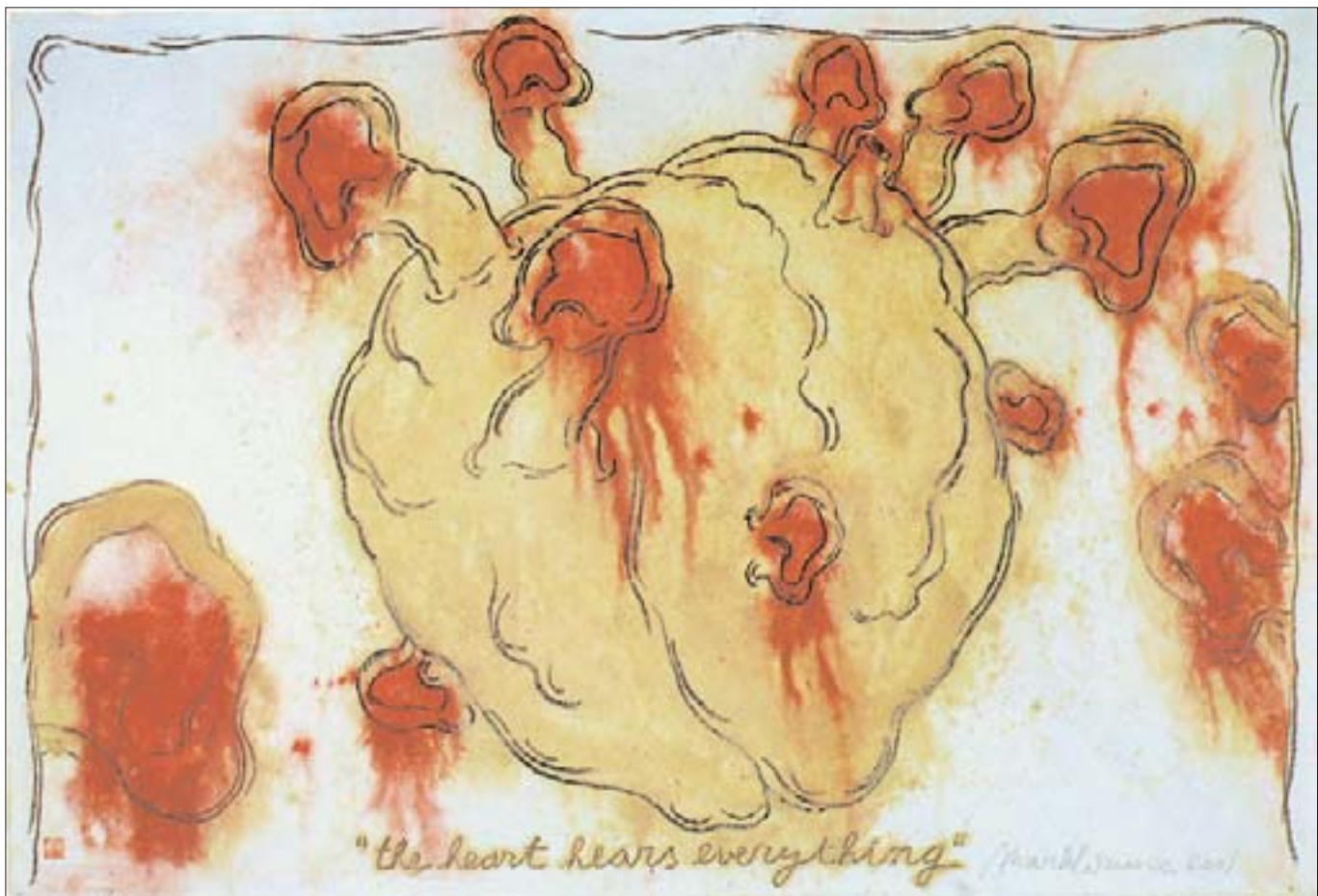
The heart hears everything.

2001, tempera sur papier marouflé sur toile, 103 x 207 cm.