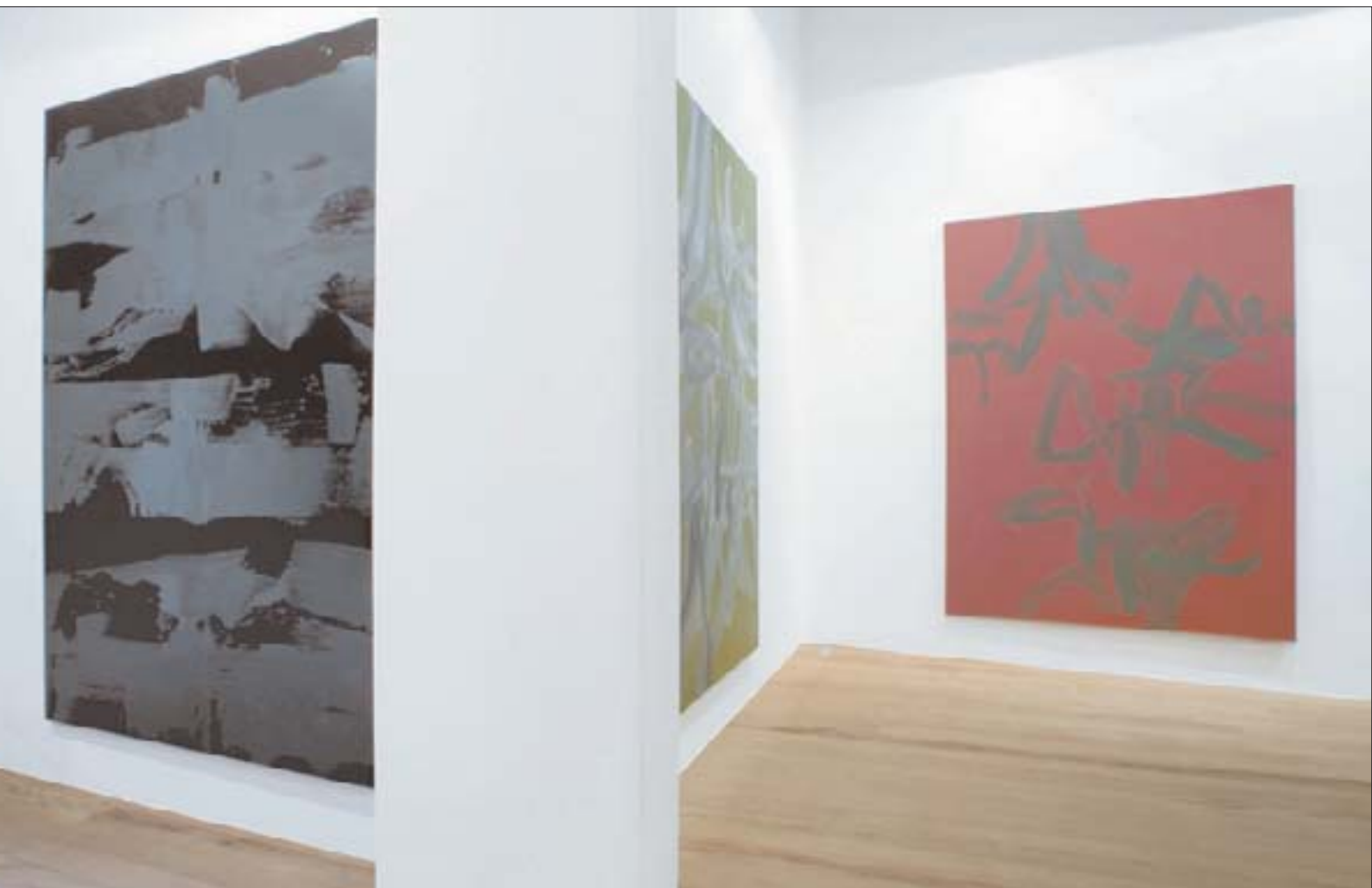
Vue de l'exposition à la galerie Laurent Godin, novembre 2005.

GT Je ne crois pas. Si l'on veut qu'il y ait une scène française, la meilleure solution est de ne pas insister sur le Franco-français. Il faut une bonne dose d'hypocrisie ou une paire de lunettes en contre-plaqué marine pour croire que ça pourra changer le cours des choses. Je regrette de le dire dans une revue qui consacre un numéro à cette fiction qui nous piège tous. ■