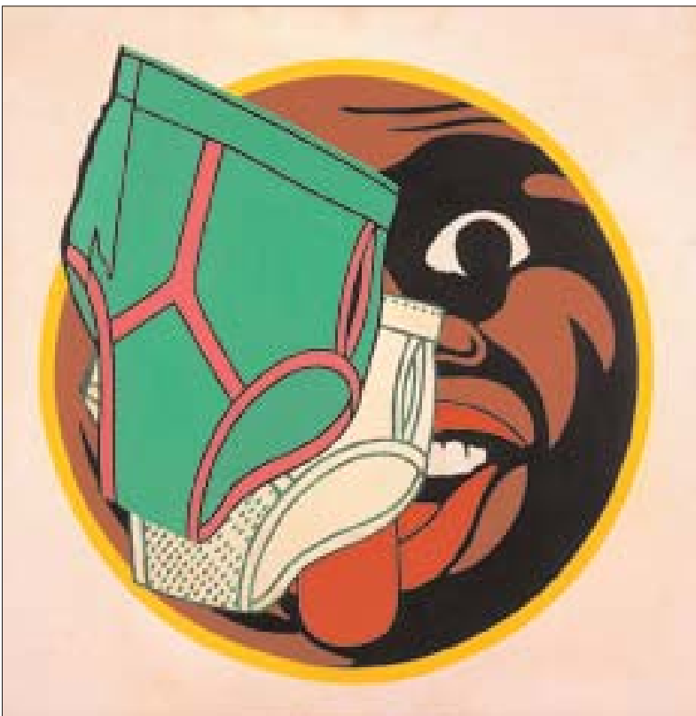
Petit célibataire, un peu nègre et assez joyeux.

HTI Paris avait été la capitale des Arts au début du siècle dernier, avec des artistes de tout premier ordre ; New York a décidé qu'il fallait inverser la vapeur. Il y a eu une entreprise d'assassiner toutes valeurs venant de Paris. Cependant, aujourd'hui, il y a de très bons