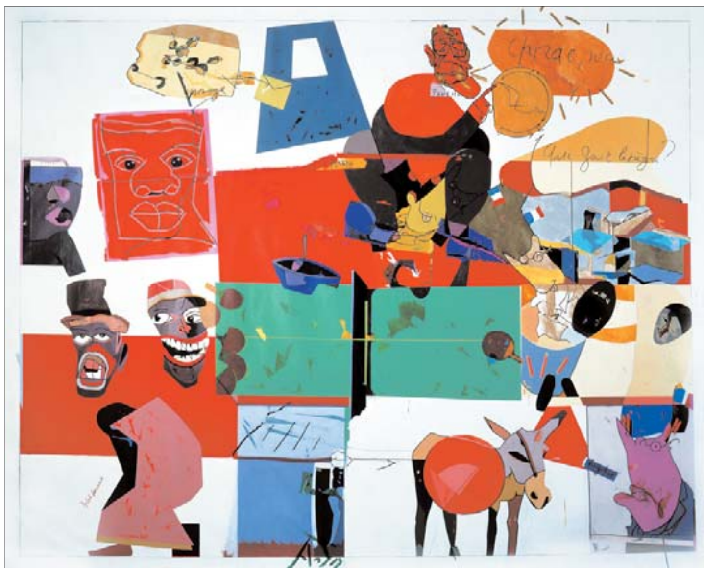
Fonds d'actualité n° 1.

artistes émergents (avec un peu de bluff et quelques mensonges...), du fait des initiatives culturelles prises depuis les années quatre-vingt : écoles d'art performantes, initiatives stimulantes, etc. On peut maintenant attendre de la scène parisienne bien mieux que Londres, Cologne ou Milan. Et les choses se normalisent tout doucement. Il faut donc que les artistes français reprennent confiance. La politique très critiquée de l'État commence à porter ses fruits, et le système français n'est pas si mauvais que ça. Enfin, maintenant, les jeunes artistes ont des possibilités d'expression formidable. ■