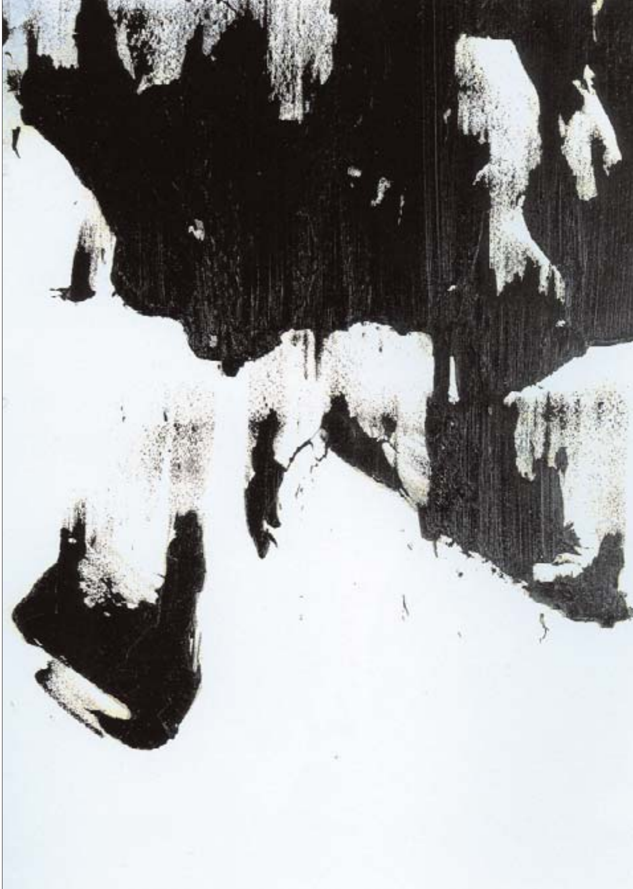
Écriture en masse.

1965, huile sur toile, 160 x 110 cm. Collection privée France.