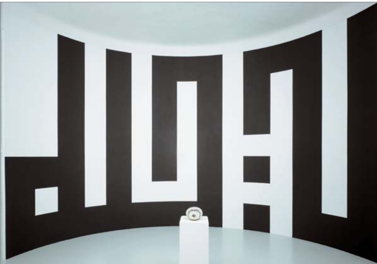
I have a dream. 2005, wall painting, vue de l'exposition Art de l'Islam et abstraction géométrique.

Espace de l'Art Concret, château de Mouans-Sartoux.