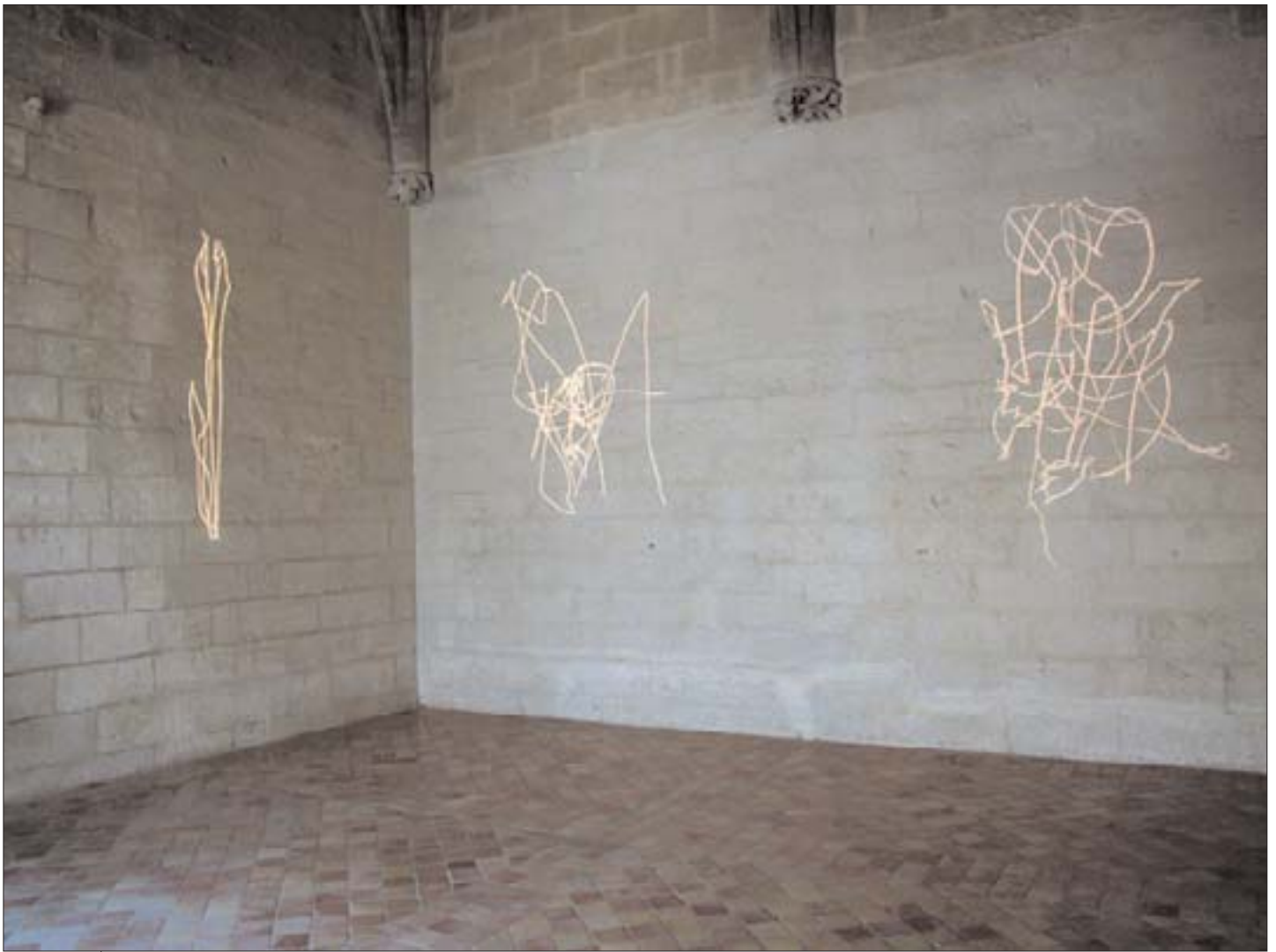
La mémoire du vent.

2002, dessins de lumière, dimension variable. Exposition Les visiteurs , 2005, Tarascon. Collection du Fnac, Paris.