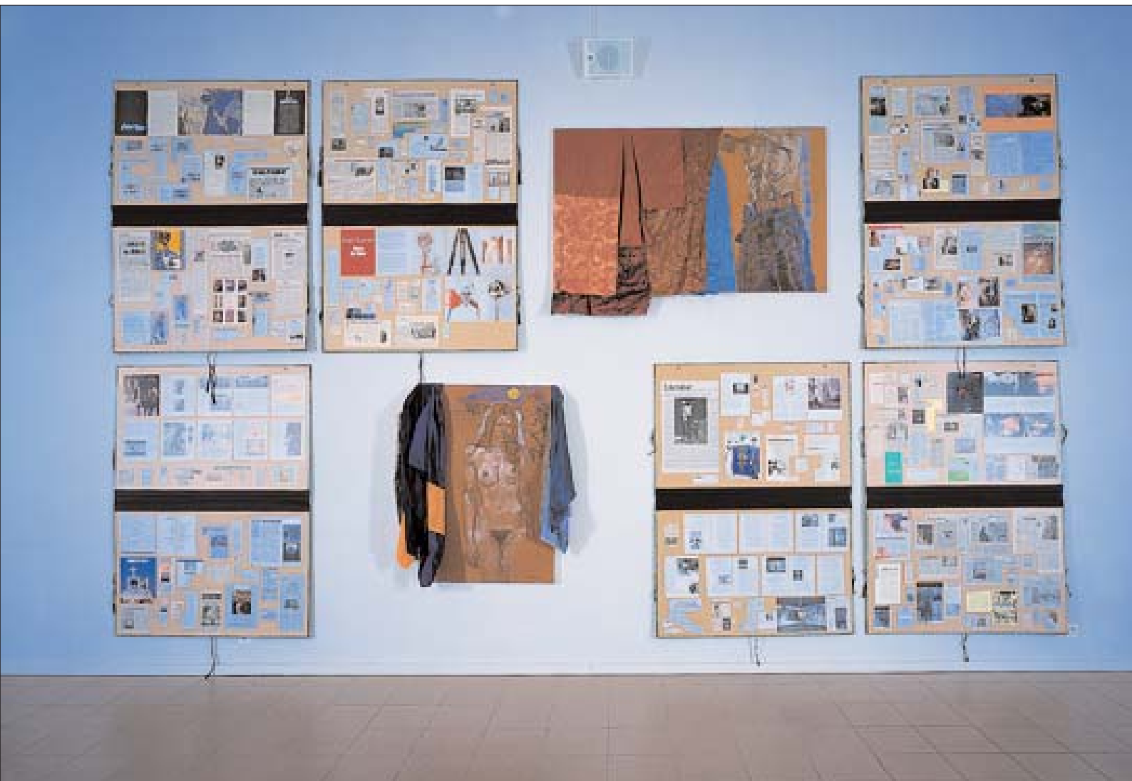
Le Récit II. Vue partielle, 1973-2005.