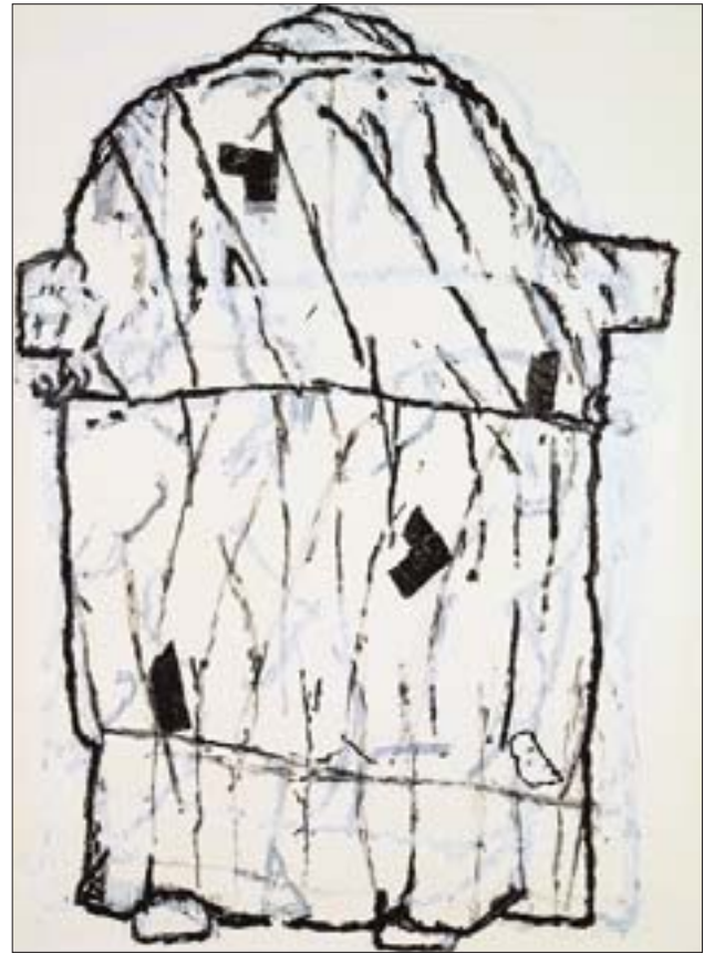
Personnage. 2000-2001, acrylique, papier marouflé sur toile.