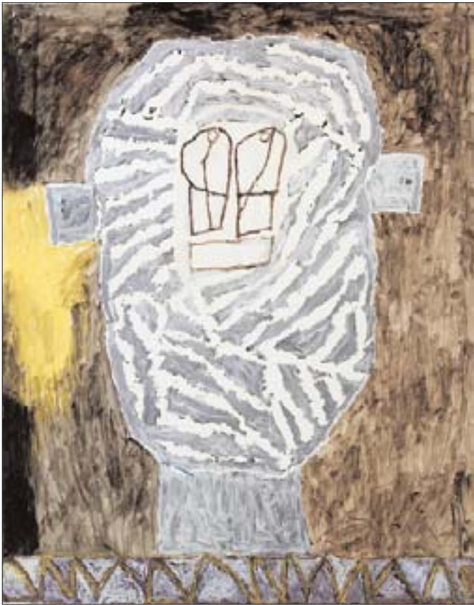
Têtes. 2005, acrylique sur papier.