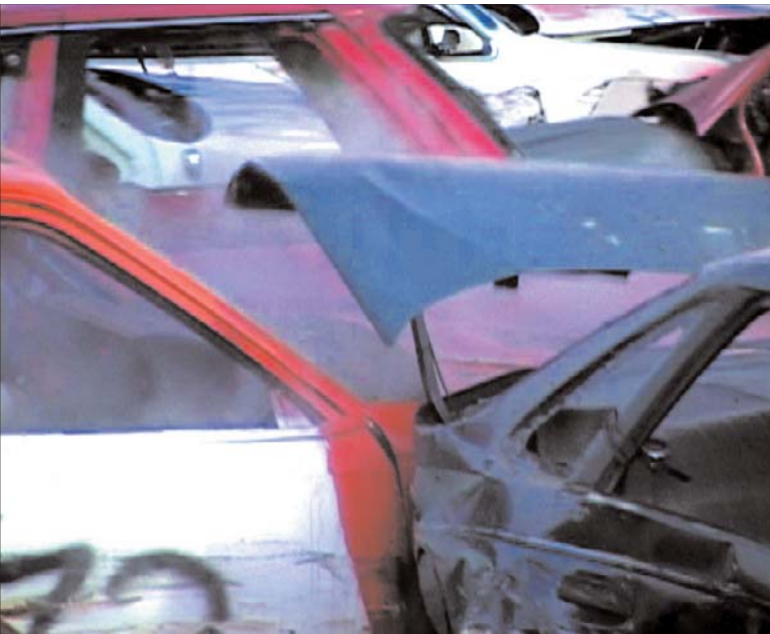
Grand Prix. 2006, vidéo.