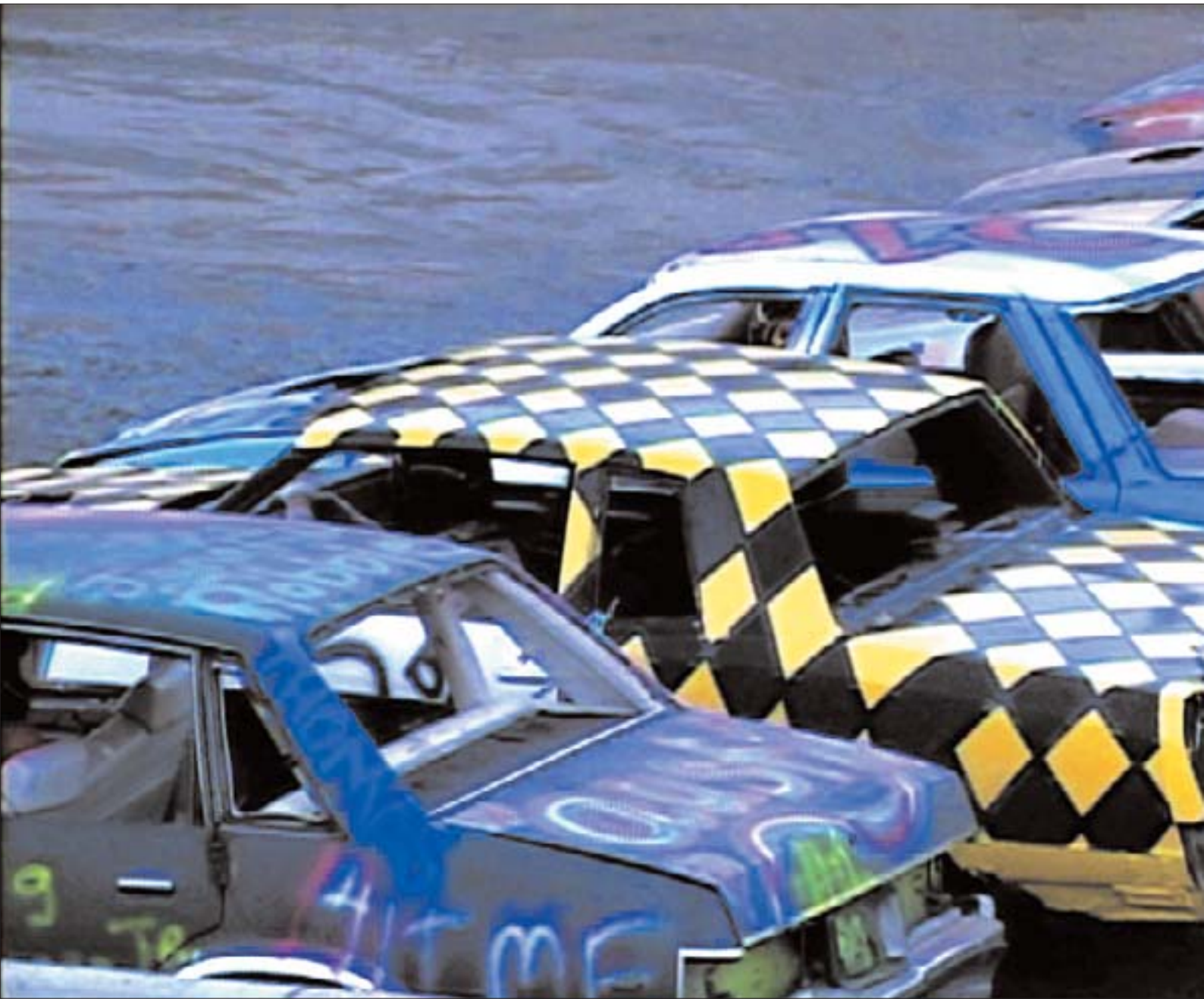
Grand prix. 2006, vidéo.