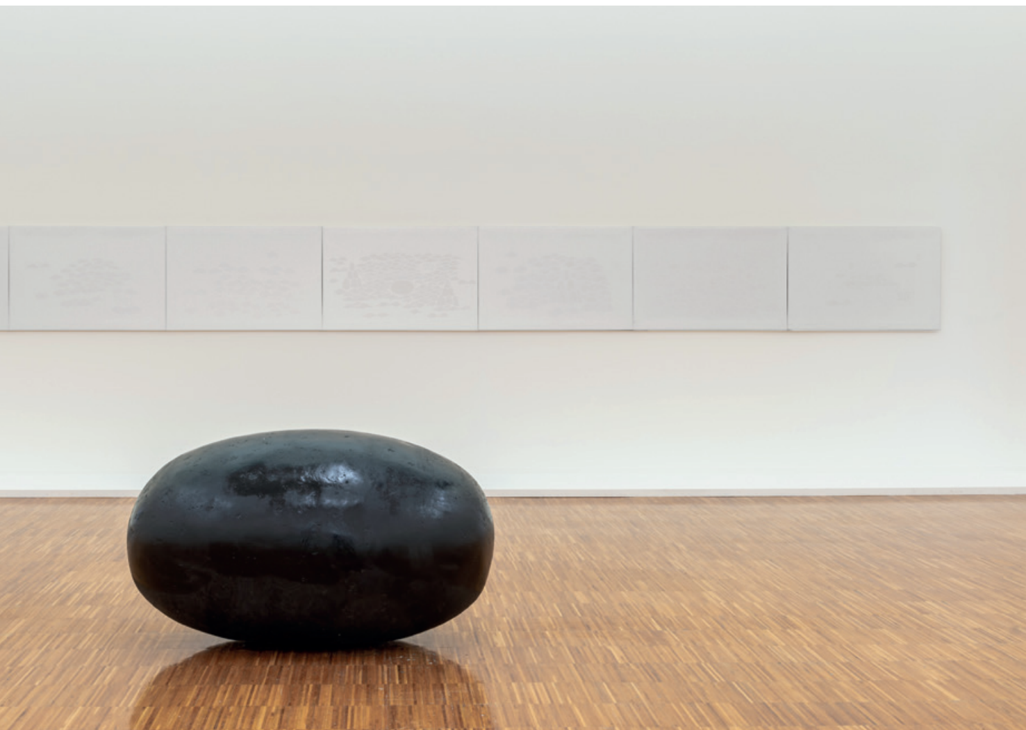
Vue de l'exposition De la nature , musée de Grenoble, 2022. Wolfgang Laib. Brahmanda . 2016, granit indien noir, huile de tournesol, suie noire.

Cela tient sans doute à la surexposition que connaît l'œuvre et à l'impression de répétition qui en découle. Mais cela tient peut-être également à la nature même du travail de Penone. Lorsqu'il décide de frotter la toile à même les troncs d'arbres pour restituer toutes les sensations vécues, lorsqu'il dessine avec le jus des feuilles, pour révéler une écriture secrète et vitale, Penone expérimente un contact, une conversation avec les êtres qui l'environnent. Tout comme lorsqu'il réalise des actions, des performances aussi minimales et non interventionnistes soient-elles, c'est l'instant et la situation qui comptent. Mû en un objet muséifié, le résultat – qui prend aussi la forme d'un constat – peine à conserver la fraîcheur du protocole premier.